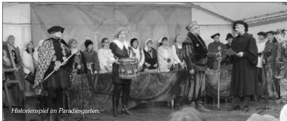
Historienspiel im Paradiesgarten.

Für alle Martins und Katharinas ergeht herzliche Einladung zu einem inszenierten Essen am 10. April, 19.00 Uhr, in und an der Dreifaltigkeitskirche mit Martin Butzer und Martin Luther sowie Katharina Zell und Katharina von Bora. Lassen Sie sich überraschen.