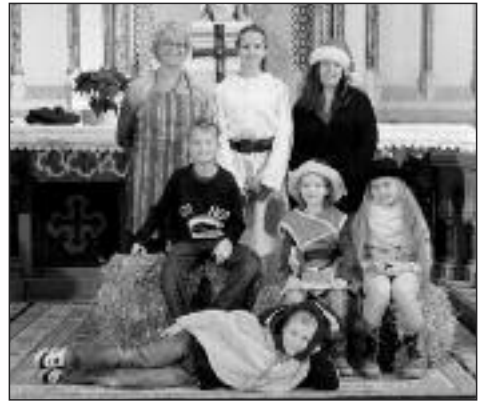
Teilnehmer am Krippenspiel in der Gedächtniskirche.