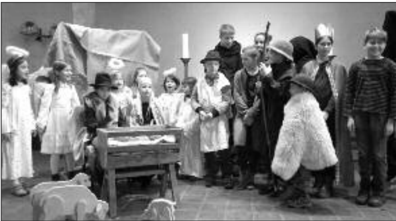
Auch in der Heilig-Geist-Kirche wurde ein Krippenspiel aufgeführt.