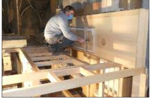
Aufbau der neuen Chororgel